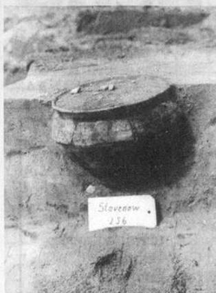
Gefäße aus einer frühdeutschen Töpfergrube von Bibow, Kreis Sternberg, ca. Anfang 14. Jh. (Foto links). Frühkaiserzeitliches Urnengrab während der Ausgrabung in Stavenow, Kreis Perleberg, 2. Jh. u. Z.